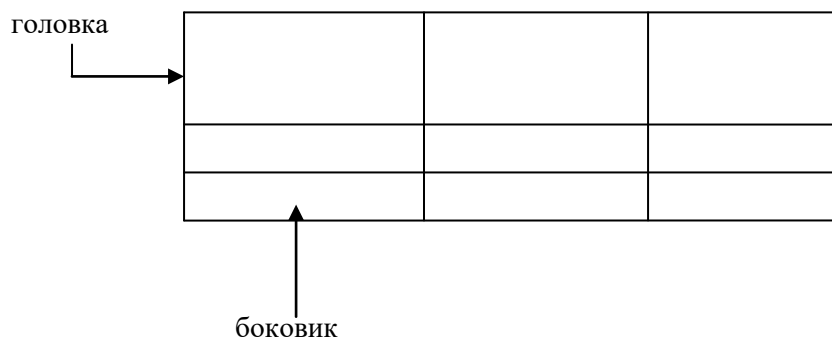
Таблица _____ – _____ номер название таблицы

Допускается помещать таблицу вдоль длинной стороны листа документа.