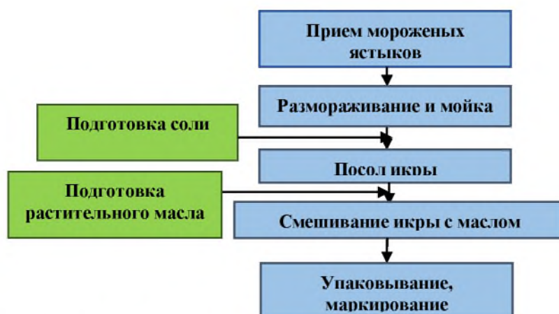
Рисунок 3.2 – Технологическая схема производства икры сельди соленой ястычной

Иллюстрации каждого приложения обозначаются отдельной нумерацией арабскими цифрами с добавлением перед цифрой обозначения приложения. Например, рисунок В.4.