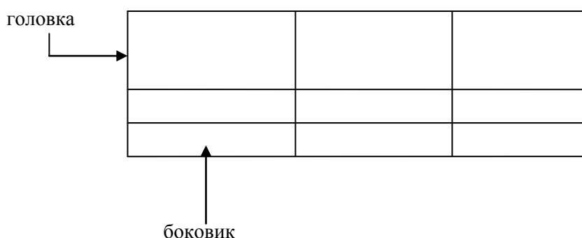
Таблица _____ – _____ номер название таблицы

Допускается помещать таблицу вдоль длинной стороны листа документа.