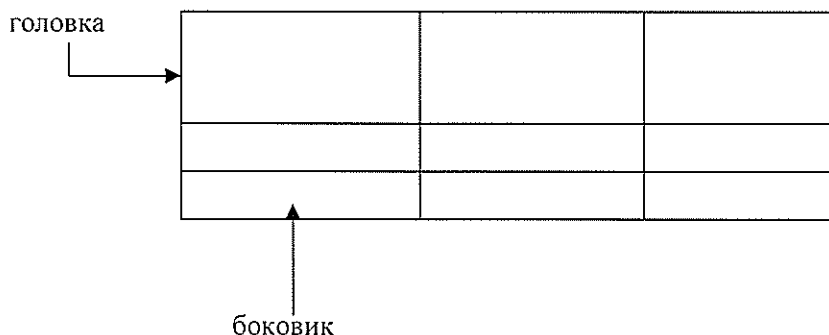
Таблица _____ – _____ номер название таблицы

Допускается помещать таблицу вдоль длинной стороны листа документа.